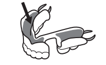
(図2-4) 部分入れ歯用 入れ歯の床全体にぬる